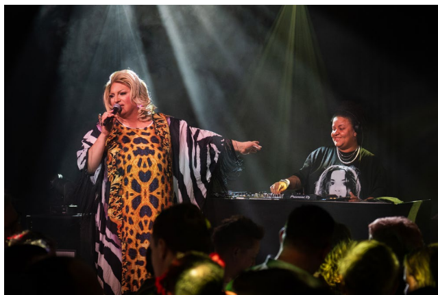
Gooise Pride Party

We zijn in Nederland hét podium voor legacy soul en funk. Onze activiteiten zijn altijd gericht op het verrijken van de muziekbeleving, het verbinden van mensen door middel van muziek en het verrassen van ons publiek met unieke ervaringen. Met een breed scala aan niches streven we naar een inclusieve programmering die de diversiteit van Hilversum en haar bezoekers weerspiegelt.