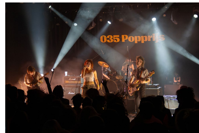
035 Popprijs-winnaar Clitteband

De Vorstin faciliteert met haar oefenruimten, podia en programmering een ontwikkelingsketen voor talent; van amateurs tot professionals in het lokale popcircuit. Lokale en regionale beginnende bands bieden we de mogelijkheid podiumervaring op te doen door hiervoor ruimte te bieden binnen onze programmering. Door regionale talenten intensiever te begeleiden stimuleren we het lokale popklimaat.