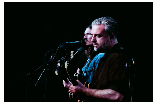
Kensington live bij AVROTROS Muziekcafé

In totaal vonden in 2025 39 uitzendingen van het AVROTROS Muziekcafé vanuit De Vorstin plaats, met optredens van onder andere MY BABY, WIES en Kensington .