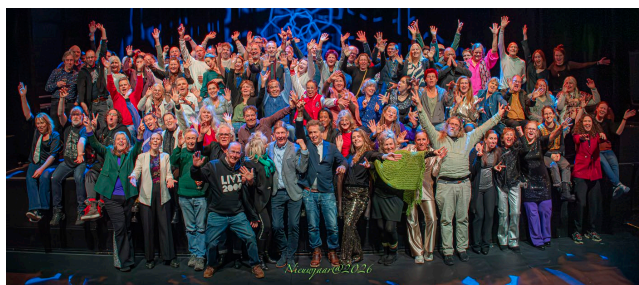
Personeel en vrijwilligers van De Vorstin

10 duizend uur werk verrichten. Vertegenwoordiging van de collectieve belangen van de vrijwilligers is georganiseerd in de vrijwillige-medewerkersraad die de organisatie adviseert.